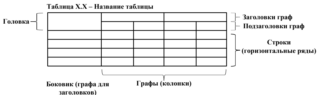
Рисунок 2 – Пример оформления таблиц

Пример оформления таблицы приведен на рисунке 2.