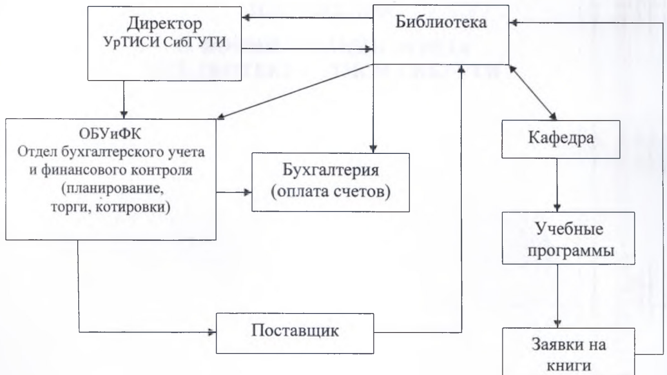
Схема взаимодействия при комплектовании библиотечного фонда