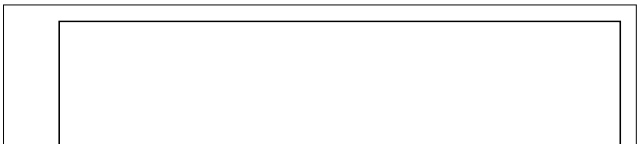
Рисунок 2 – Форма листа содержания реферата